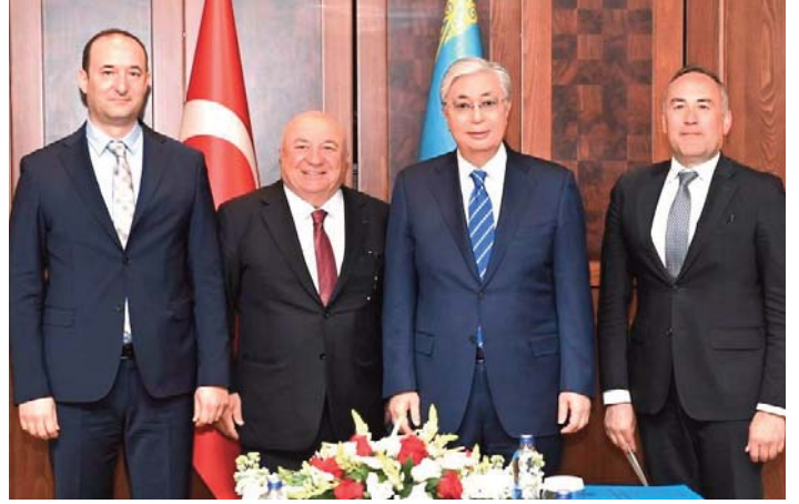
Soldan sağa, TAV Kazakistan Genel Müdürü Alper Ersoy, TAV HAVALİMANLARI AŞ Yönetim Kurulu Başkan Vekili Sani Şener, Kazakistan Cumhurbaşkanı Kasım Cömert Tokayev, TAV HAVALİMANLARI AŞ İcra Kurulu Başkanı Serkan Kaptan

Öte yandan Türk firmaların Kazakistan'a yatırımları rekor seviyeye ulaştı. Son bir yılda Türkiye'den Kazakistan'a 362 milyon 400 bin dolar tutarında yatırım geldi. Böylece, 30 yılda Türkiye'den gelen yatırımların toplam bedeli 4 milyar doları bulurken Kazakistan'dan gelen yatırım miktarı da 1 milyar doları aştı.