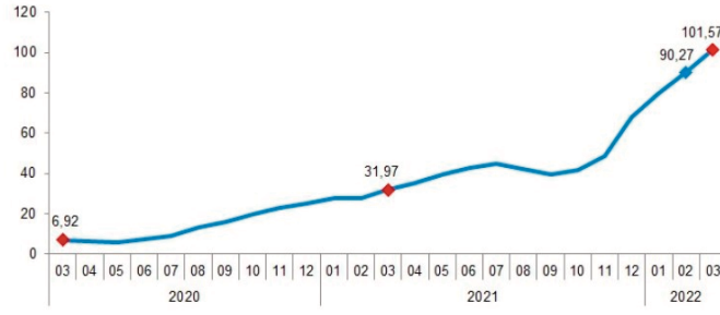
İnşaat maliyet endeksi yıllık değişim oranı (%), Mart 2022

deksi yüzde 1,22 arttı. Ayrıca bir önceki yılın aynı ayına göre malzeme endeksi yüzde 128,11, işçilik endeksi yüzde 42,59 arttı.