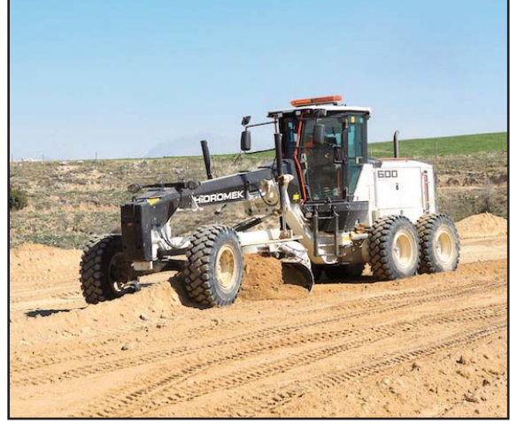
HİDROMEK, Japonya'ya karla mücadelede kullanılmak üzere gönderilen motor greyderler ile Türkiye'den Japonya'ya ilk iş makinesi ihracatını da gerçekleştirmişti

kineleri üreten en büyük firmaların sıralandığı uluslararası 'Yellow Table' listesinde yer alan ilk ve tek Türk makine üreticisi HİDROMEK olmuştur. 'Yellow Table 2023' listesinde de yer alan HİDROMEK, listeye 9'uncu kez girmiştir. Bunun yanında, HİDROMEK, İMDER (Türkiye İş Makinaları Distribütörleri ve İmalatçıları Birliği) tarafından açıklanan, 2009-2019 yılları arasındaki verilere göre Türkiye'de aralıklı 11 yıl kazıcı yükleyici, 8 yıl hidrolik ekskavator ve 2 yıl motor greyder satışlarında pazar lideri olmuştur.