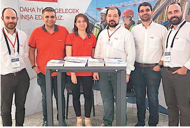
Hilti Türkiye standında sektör profesyonellerine farklı konularda sunumlar yapıldı

Uluslararası Yapısal Beton Federasyonu Sempozyumu'nda hizmetleri ve ileri teknolojileri ile öne çıktı. Bilim insanları, mühendisler, uygulayıcılar ve çok sayıda katılımcının yer aldığı etkinlikte Hilti, standı ve stantta yaptığı sunumlarla da dikkat çekti. Geleceği